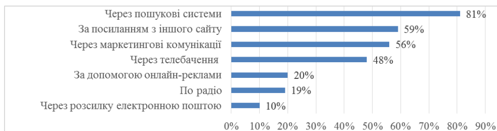
Рис. 1. Джерела переходів користувачами на сайт

Термін «пошукова оптимізація» (search engine optimization) увійшов у широкий обіг у 1997–1998 роках і приписується Денні Салівану (Danny Sullivan), який тоді працював із сайтом Search Engine Watch, хоча сам він стверджує, що точно